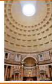
Panteón de Roma.