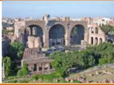
Basilica de Majencio, en Roma