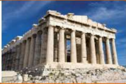
Partenón de Atenas